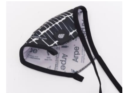
Logo de la Fundació a la part interna de la mascareta